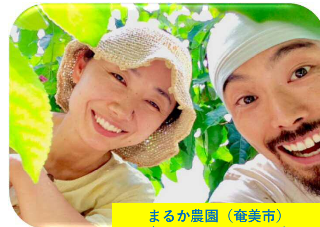
まるか農園（奄美市） （パッションフルーツ）