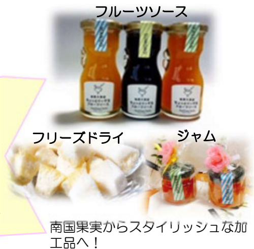
南国果実からスタイリッシュな加工品へ！

農業経営の安定のため、今年女性農業経営士を取得したい！ 販路拡大に向け、島外の百貨店や委託先確保（島外での物産展やマルシェ参加）！ 奄美群島の農業女子メンバーを増やして一緒に活動したい！