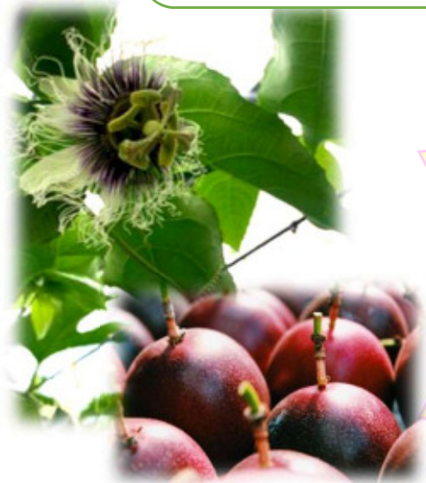
パッションフルーツ 花 & 果実

平成23年に主人が脱サラし、就農。 令和元年にパッションフルーツのハウス増設を機に、私も仕事を辞めて農業に専念。 以前から気になっていた、船便欠航等により出荷出来ない完熟果実を有効活用できないかと思い、加工品の開発販売にチャレンジ!