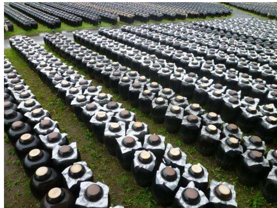
霧島市福山町の黒酢壺畑