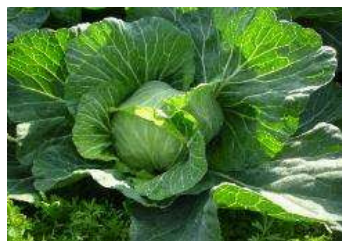
指宿市の春キャベツ