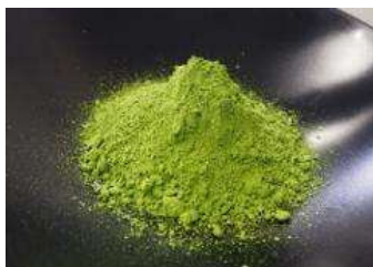
霧島市の有機抹茶