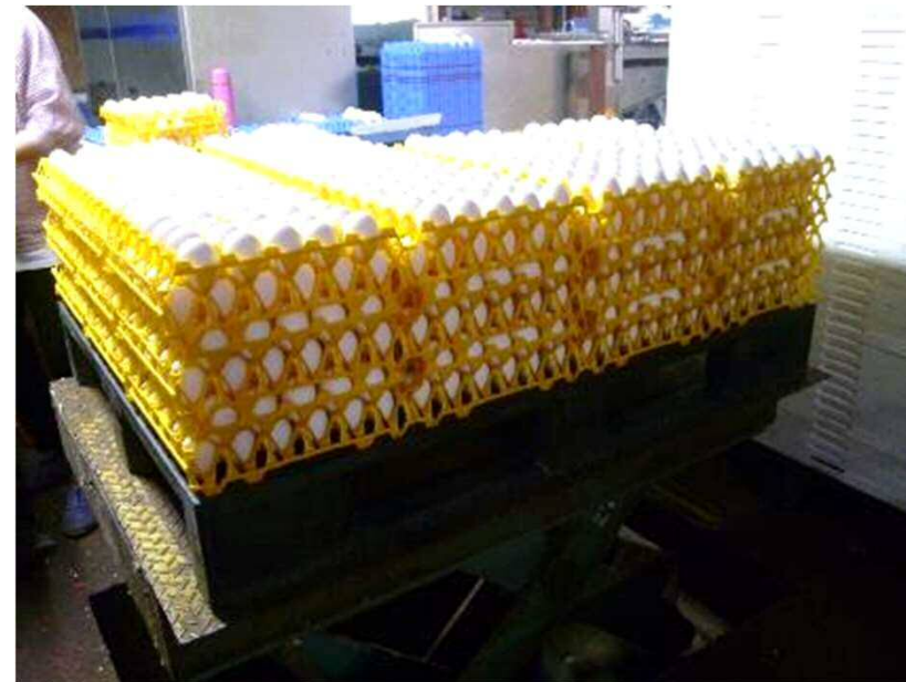
鶏卵の選別作業(外国人技能実習生)