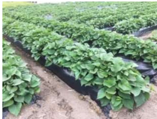
かんしょ作付け圃場

東京の高級食品を取り扱うデパ地下で野菜販売をしていた。美しい野菜を見ているうちに自分でも野菜を生産したくなった。東京で働き始めて2年後、生まれ育った鹿児島へ戻り、農業大学校で農業を学び、曾於市で実家の土地を使用して就農。