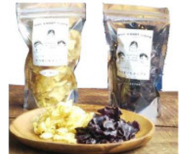
異業種間交流で開発したSOO SWEET チップス

規模拡大を図るため大型トラクターや移植機、収穫機などを揃えていく。 農業女子の模範となるようにワークショップの展開など多くの事に挑戦し、農業の魅力を伝えていきたい。