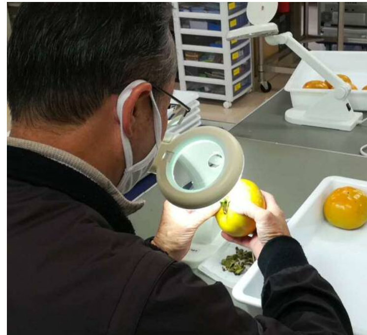
②拡大鏡での柿のヘタ周辺の確認