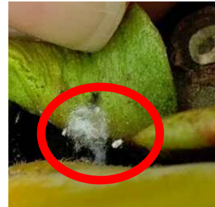
フジコナカイガラムシ