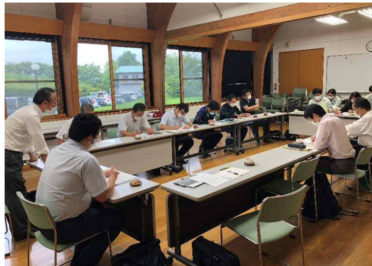
輸出検討会の様子