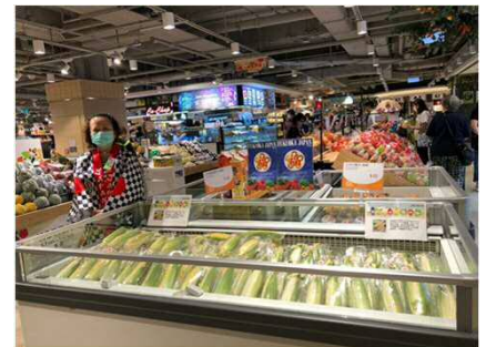
とうもろこしのフェア（香港）