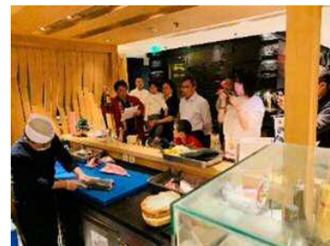
北京レストランでの 鹿児島フェア