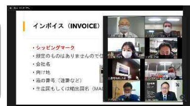
オンラインによる貿易実務講座