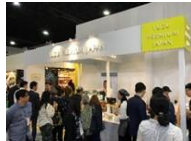
海外での展示会に YUZU PREMIUM JAPAN として出展の様子（コロナ前）