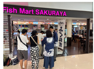
Fish Mart SAKURAYAで ふぐ商品をPRする様子

○現地のニーズに合わせたフグ加工品の提供。 ○実際に食べることでファンが増えると実感しており、口コミ宣伝が効果的。