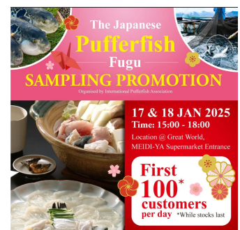
日本産フグの魅力伝える試食 イベントをR7年1月に開催！