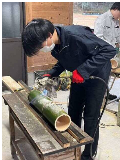
俺、この工程が好きかもです。