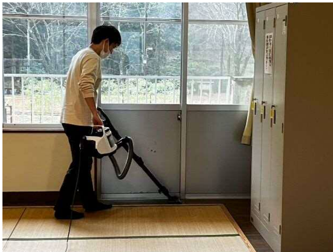
さんがうらの中も掃除して完了。