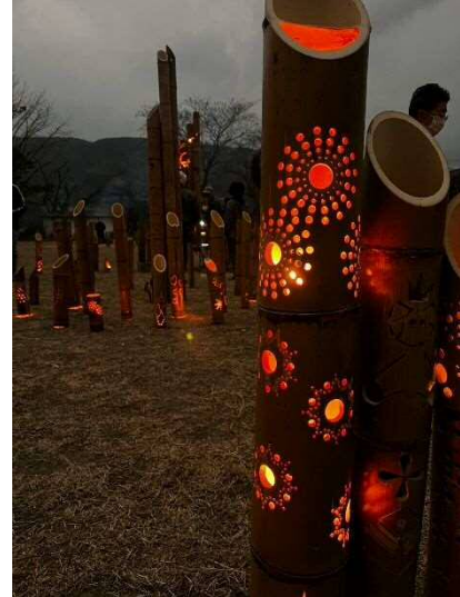
皆で製作した竹灯籠と従前の竹灯籠がどちらも味を出してますね！ 花火柄も綺麗です。