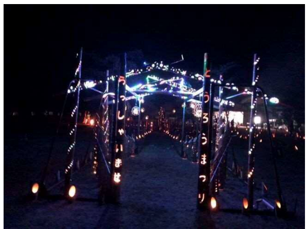
広場中央入口(イルミネーションが色鮮やかですね)