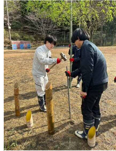
竹が倒れめよう土台のパイプを打ち込みました。