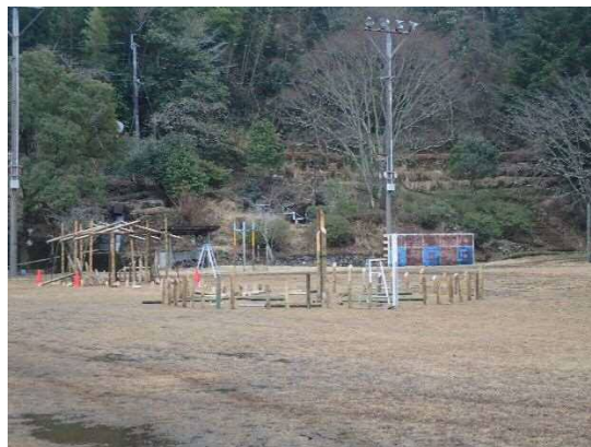
前に製作した灯籠が広場に設置されてました。