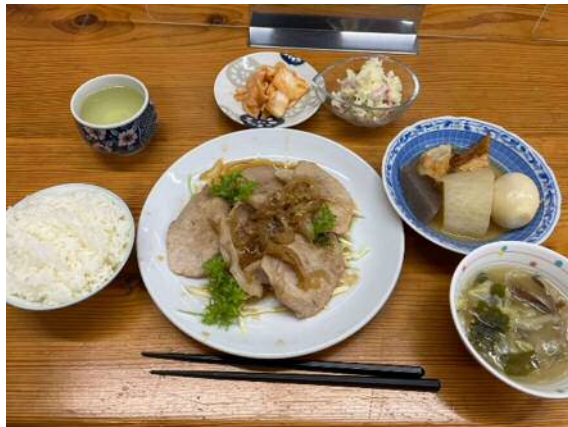
おまけ:1日目の晩飯 (生姜焼き、おでん、太平燕ほか)