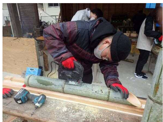
彼は最初から職人みたいですね。