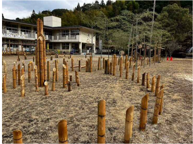
メイン広場(旧運動場)には竹灯籠が全て設置されました。