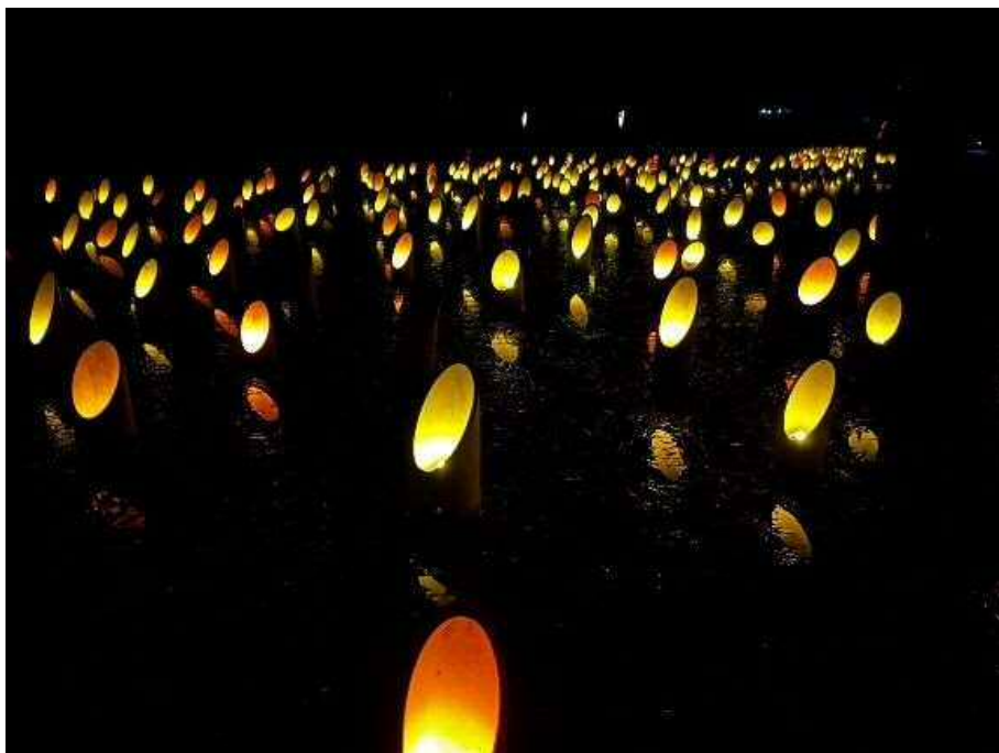
田に水を張り、竹灯籠を設置しています。灯りが水面に反射して幻想的です。