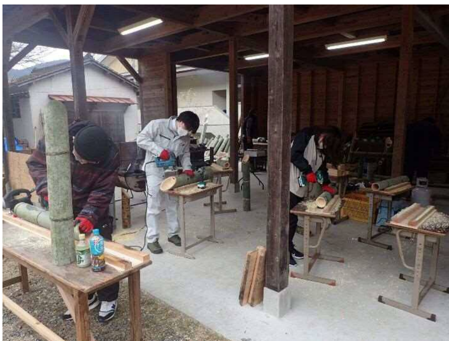
山間部に近いため、凄く寒かったですが、防寒着と時折、焚き火で暖をといながら作業を進めました。