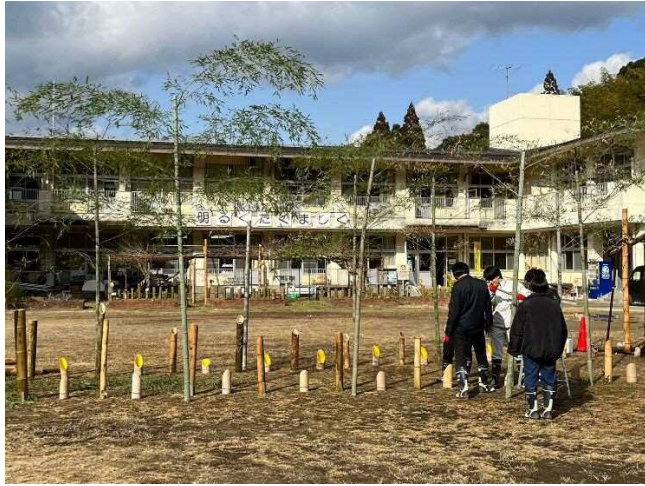
竹灯笼をメイン広場(旧運動場)に設置。