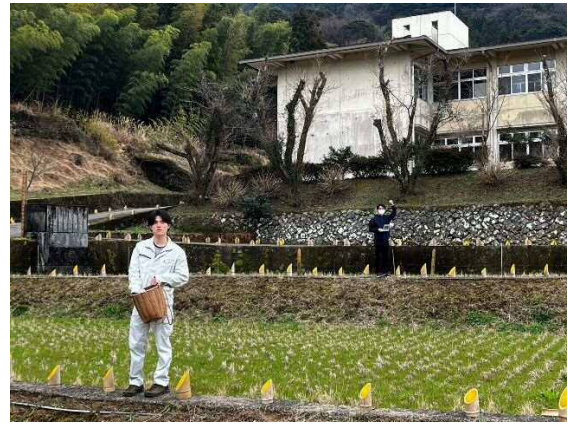
従前の灯籠祭から活躍してきた竹灯籠を施設周辺や田んぼ周りに設置。(凄く教でした)