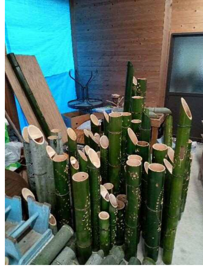
2日間の成果です(結構出来た)!