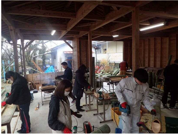
2日目は慣れてきて数をこなすべく、ひたすら製作に没頭中