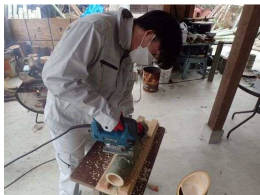
はじめてなので慎重に・・・