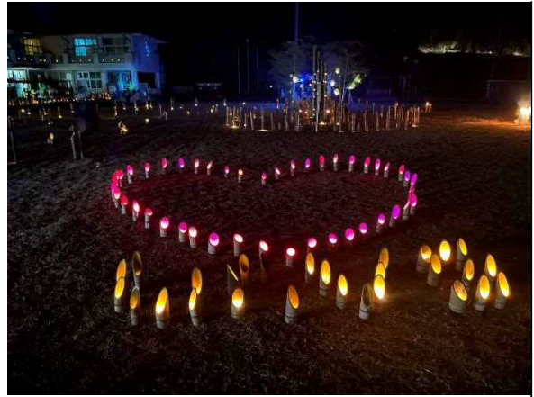
メイン広場の様子です。良い感じに暗くなり、竹灯籠が映えだし始めました。とても綺麗ですね。