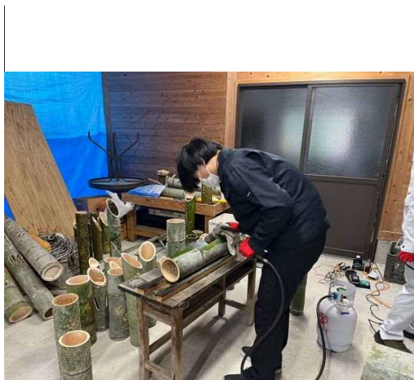
…結果、彼は職人になってました(笑)