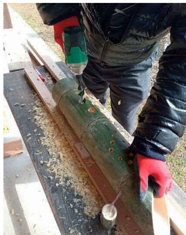
ドリルによる加工