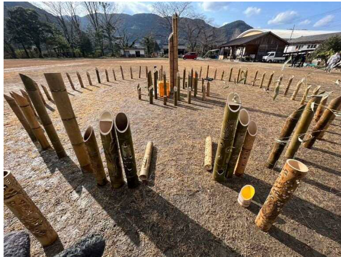
メイン広場の中央に配置する主役級の竹灯笼たち・・・本番が楽しみです。