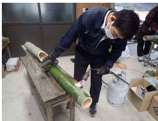
表面処理も火を使うので恐る恐る・・・。