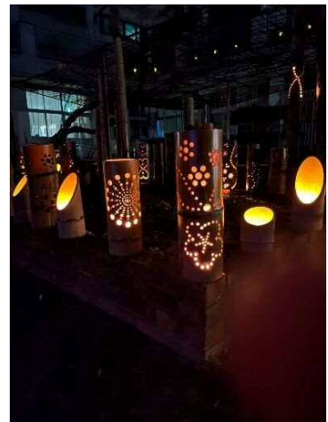
小灯籠も素敵です！