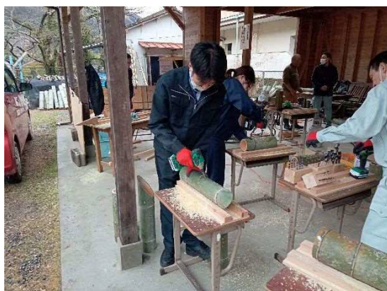
若手職員も頑張っていました！