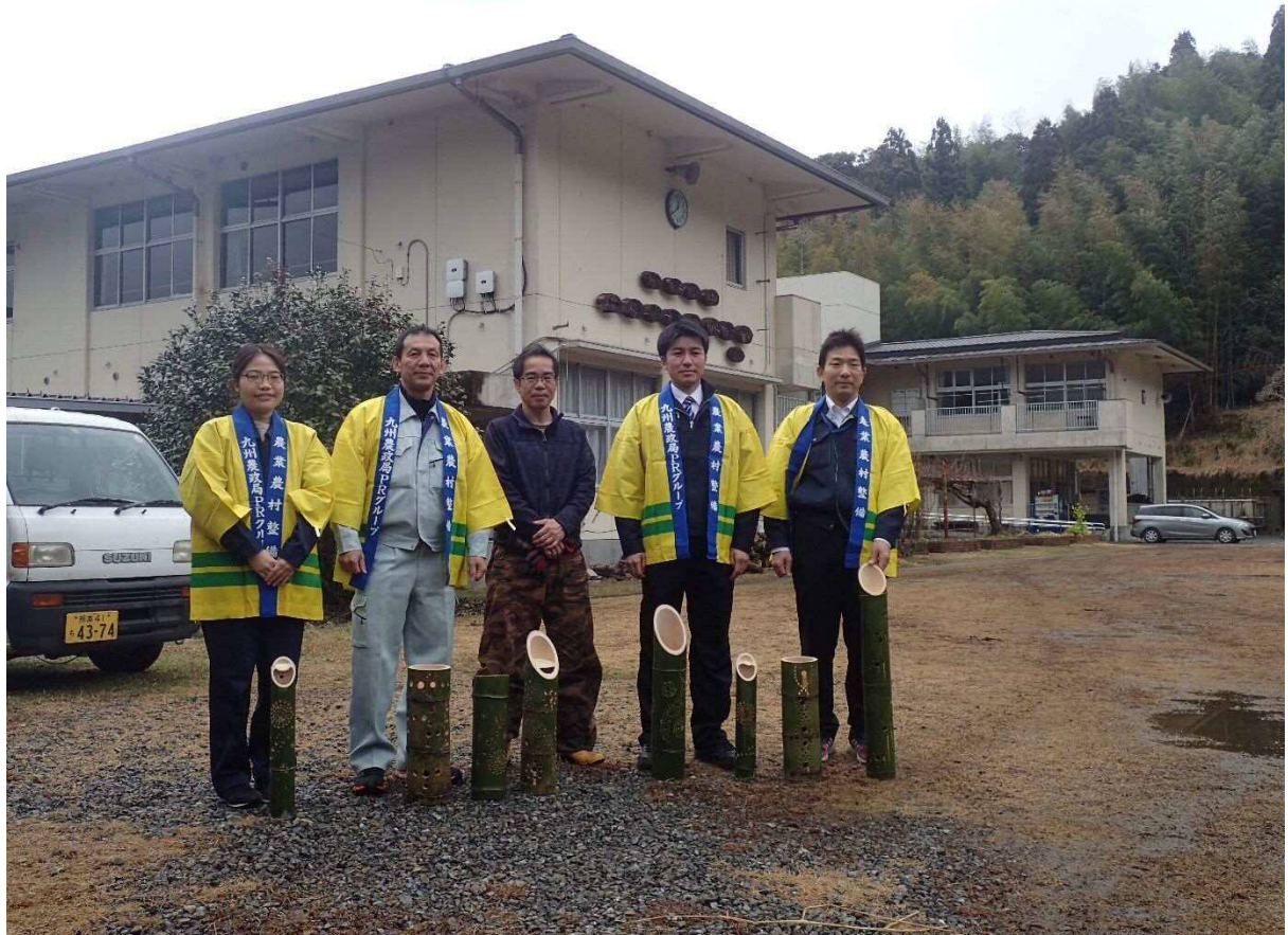
さんがうら小川施設長(中央)と植野農村振興部長及び若手職員にて記念撮影しました。