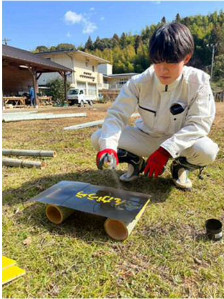
案内板も作りました！