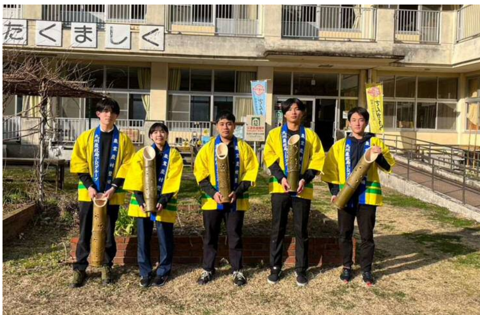
さんがうら玄関にて若手職員で記念撮影。あとは本番を待ちます。