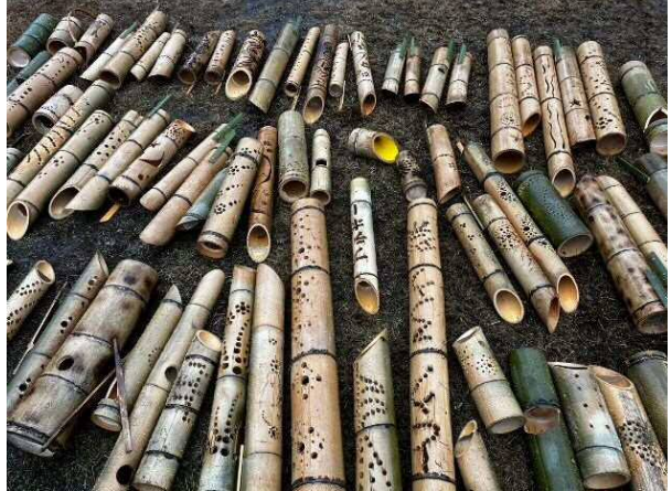
広場に広げた時の様子です。これを乾かした後に収納します。竹灯籠にお疲れ様とりたいです。