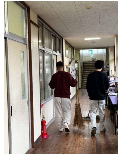
来たときよりも美しく。