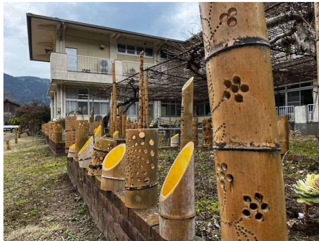
さんがうら(旧校舎)の前面部にも無事設置されました。