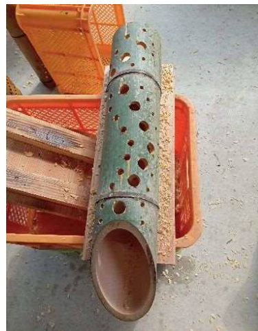
適当に開けても良く見える？