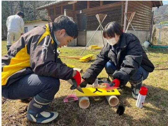
こちらは復路用です。