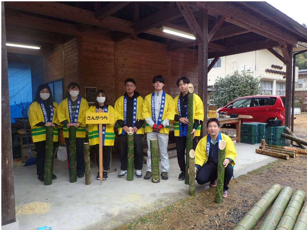
参加者一同で自慢の作品を持って記念撮影しました。