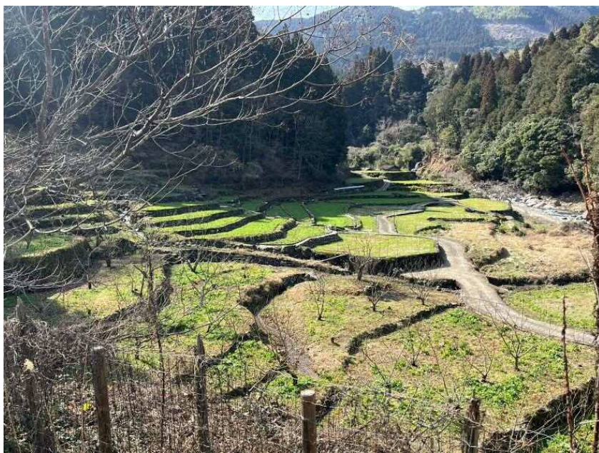
いつの間にこんな絶景写真を・・・。