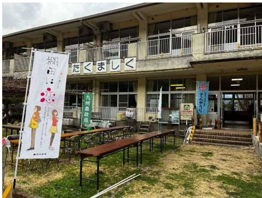
農政局ブースの準備も無事に終わりました。あとは人が沢山来ますように(>人<)