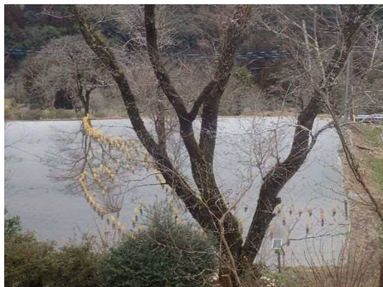
冬の田んぼ(草を刈り、水を張り、竹灯籠を設置