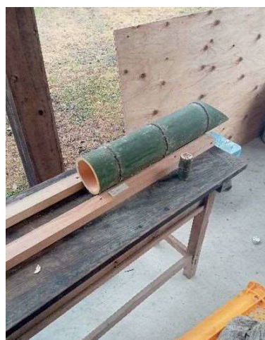
竹を固定する台座

材料となる竹は、近隣にある球磨村村長さんの山に生えているものをさんがうら関係者で調達しました。工具は電動カッター、電動ノコギリ、電動ドリル、竹加工時の固定用台座、ガスバーナーなどが必要です。ドリル先端部は付け替えが可能な大きさの異なるドリルを使用して穴を開けます。