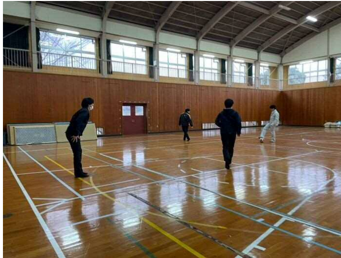
おまけ:休憩中の1枚ですが、体力が有り余ってますw