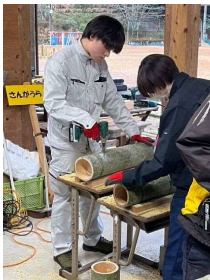
すっかり慣れた人も…。