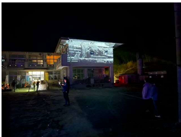
球磨村役場によるプロジェクションマッピング