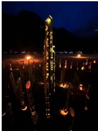
広場中央の大灯籠