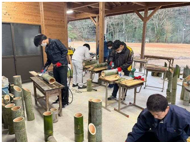
もうすぐイベント本番！最後の追い込みだ！