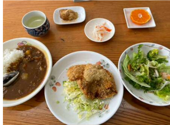
おまけ:2日目の昼飯 (カレーライス、とんかつ、サラダほか)