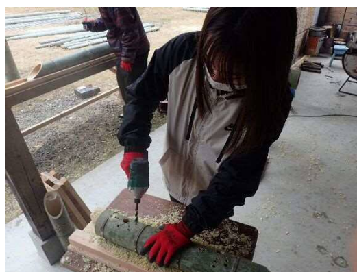
凄く集中しながら作業しています。