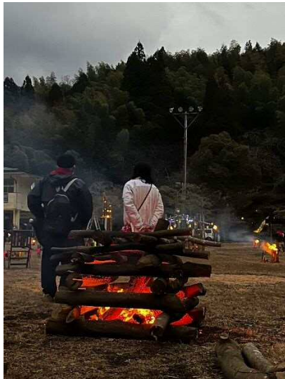
かがい火は力強いですね。