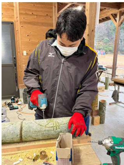
繊細な模様ですね。