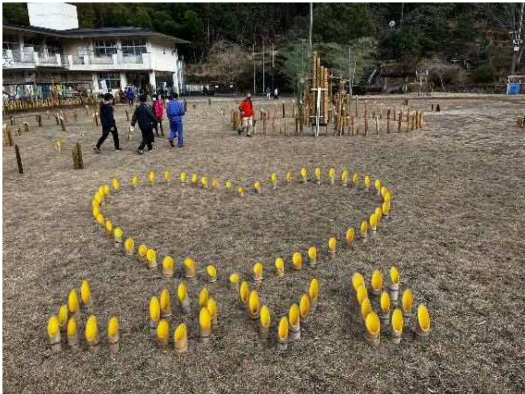
ハートマークも良い感じに映えるんでしょうね