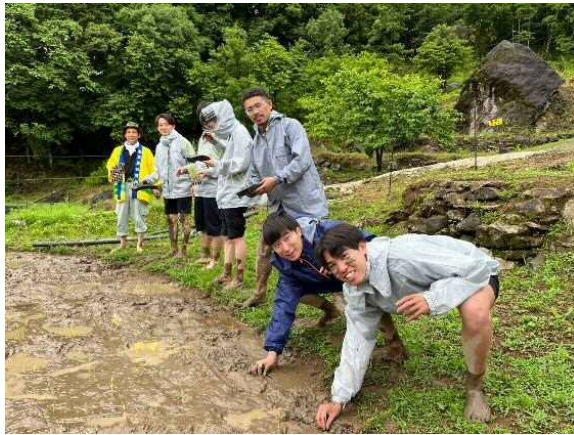
最後の1本を植えます！