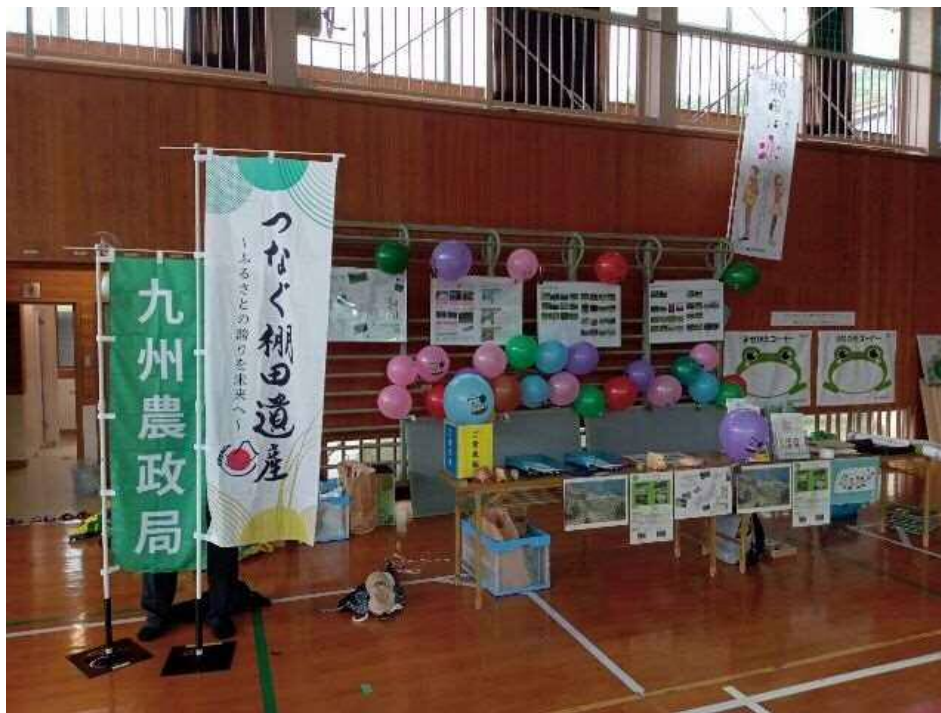
のぼり旗や展示物などの準備完了!