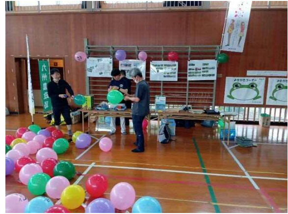
棚田カード付き風船の準備が大変でした笑