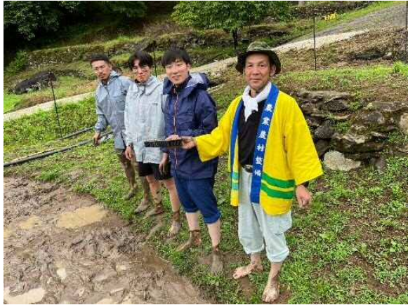
無事に植え終わりました！