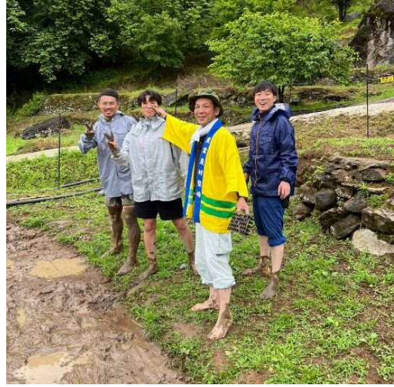
お戯れ楽しそうですね笑