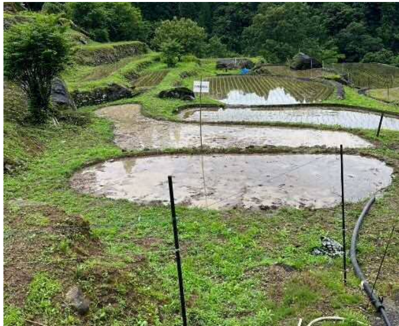
これから大きく育ちますように(>人<)