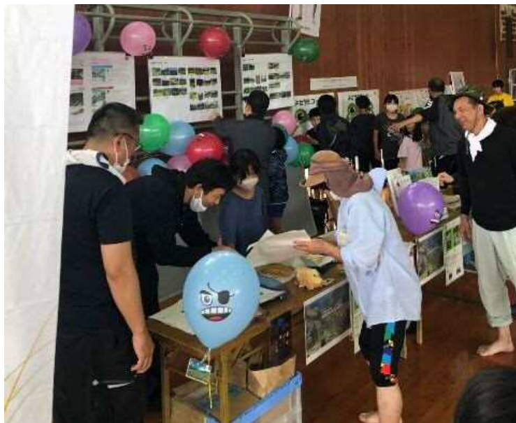
地域の方々との交流は有意義な時間でした！