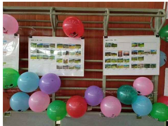
九州管内の棚田カード一覧も展示