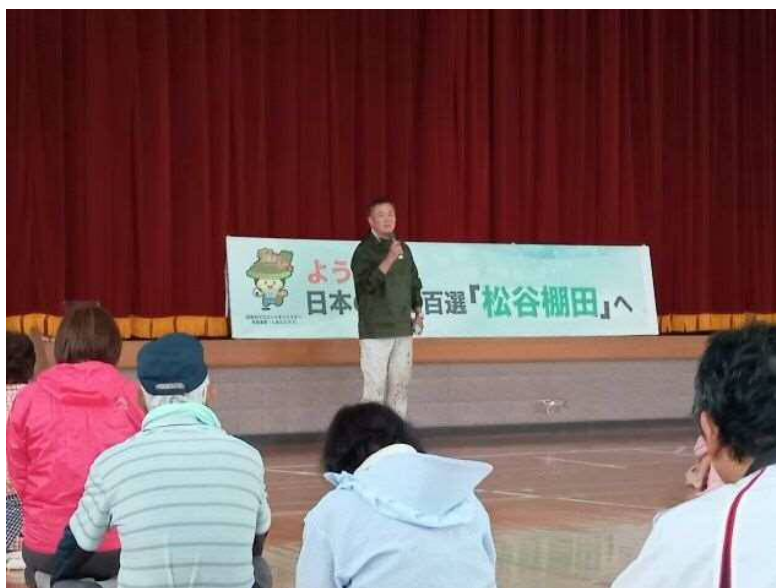
当日は小雨が降っていたため、旧体育館にて開会式があり、主催のさんがうら運営委員会から注意事項説明や球磨村村長からの挨拶などがありました。(写真:松谷村長さん)