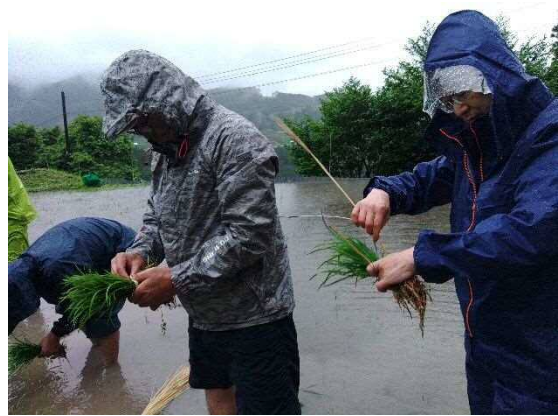
適量を藁で括ります