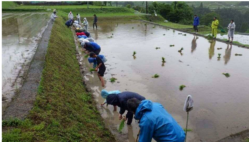
地元小学生の田植えの様子(別の田んぼ)

よせがきコーナーでは地元の小学生が田植えの感想などたくさん書いてました。 ※地元の渡小学校、一勝地小学校は来年4月より小中学校が統合となる予定であり、 渡小、一勝地小としては、最後の田植え参加でした。