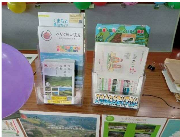
つなぐ棚田遺産関係ほか、パンフレット展示