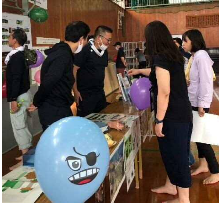
農政局ブースの賑わいも上々