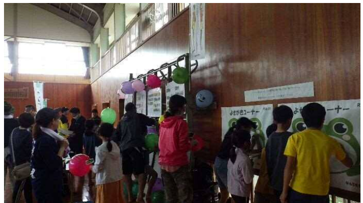
九州内の棚田カードに興味を持って見学されている方が多く見受けられました。