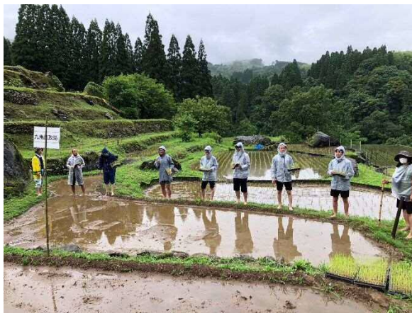
植野農村振興部長と仲間達(若手職員)