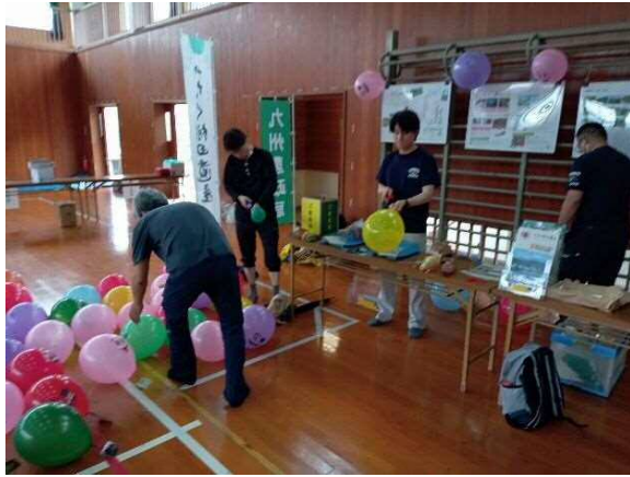
農政局ブースの準備中