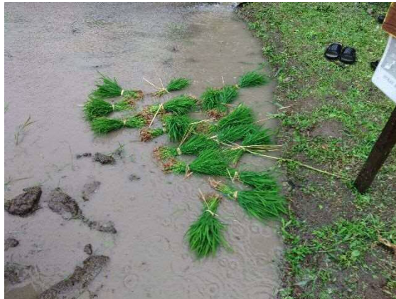
完成！（これを植えていくんですね）