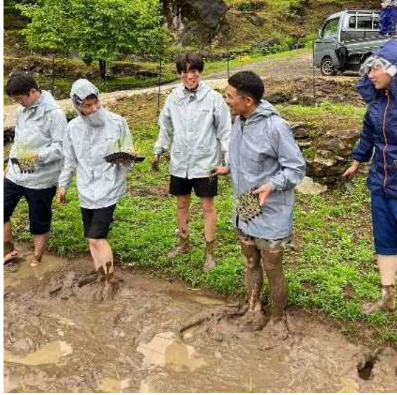
泥まみれの人もあります笑