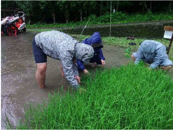
根を傷めないよう慎重に摘み・・・