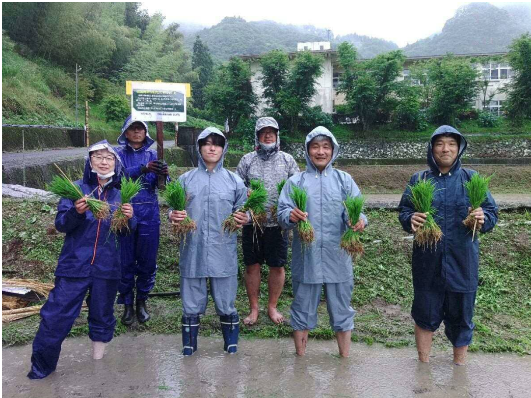
この日は地域整備課職員で体験しました！