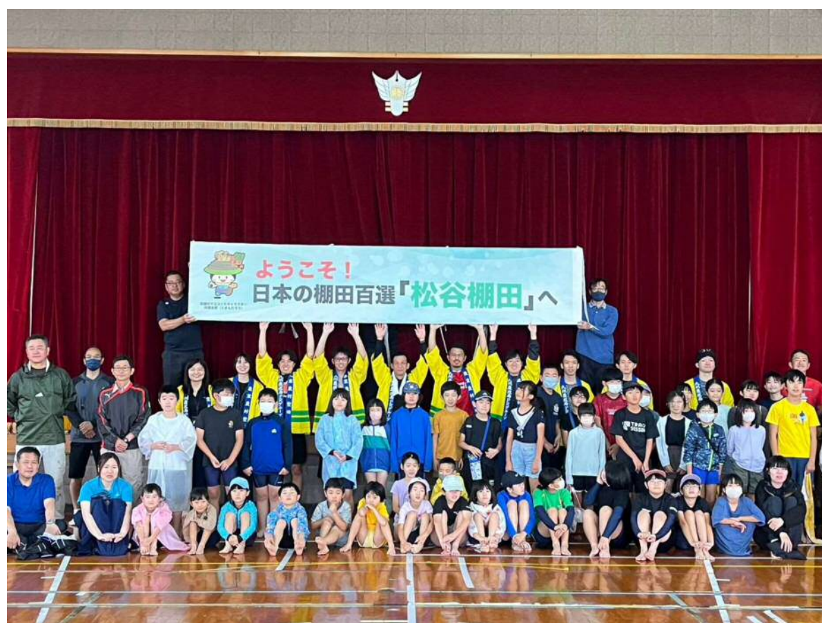
田植え前に参加者全員で記念撮影しました。