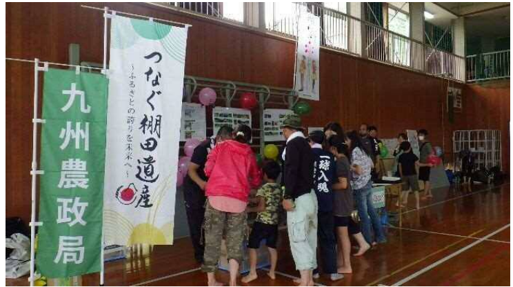
地域の小学生や地元の方々など多くの方が見学