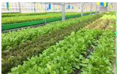
作業軽減の目的でベビーリーフを高床式砂栽培で生産