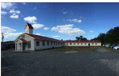
隣地の空き工場を改修して総菜加工に着手。