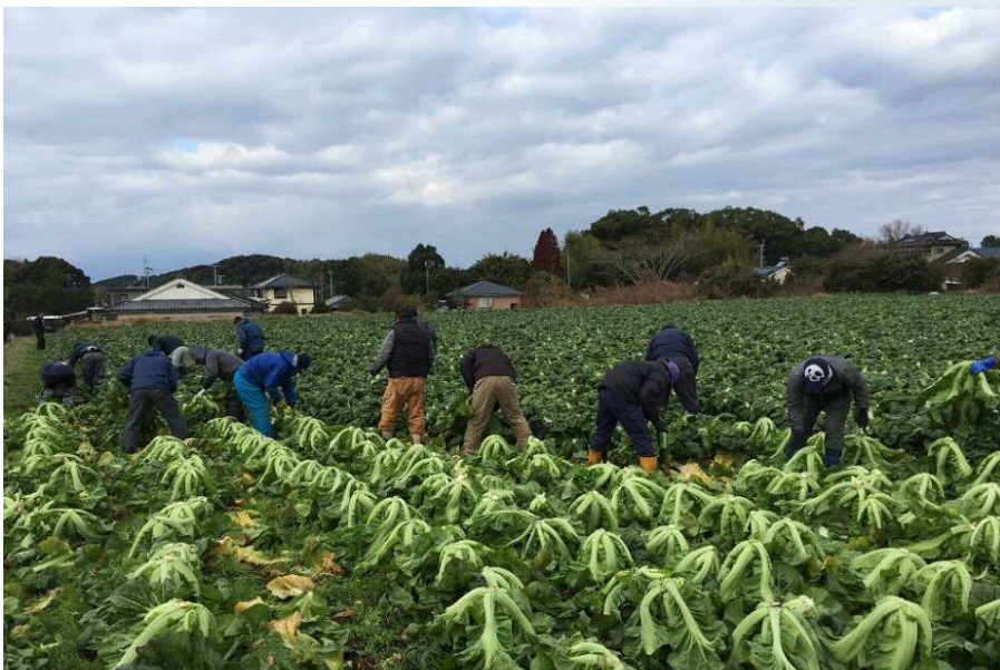
人手のいる高菜の収穫作業の様子