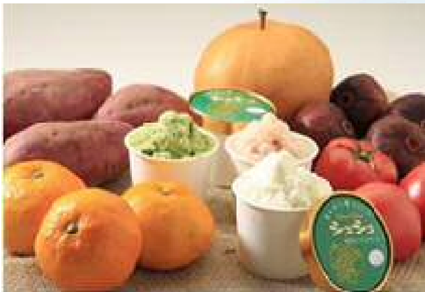
地元産の農産物を使用したジェラート