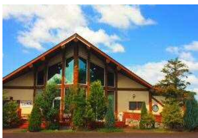
「おおむら夢ファームシュシュ」外観