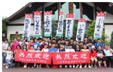
インバウンド農泊受け入れの様子集合写真