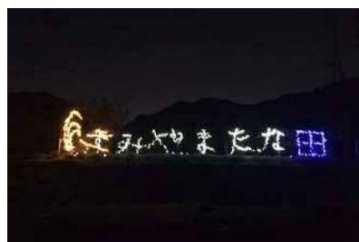
市や大学等と連携し、水力発電で棚田のイルミネーション