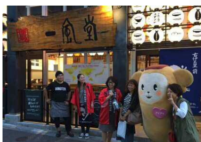
市内のスーパー等でお酒の販売会を実施