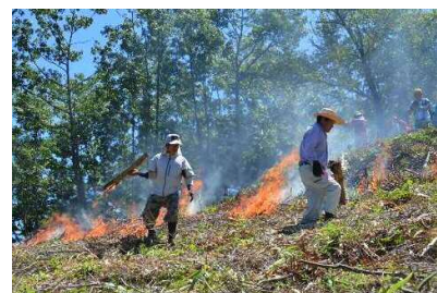
伝統の焼畑で雑穀栽培／椎葉村