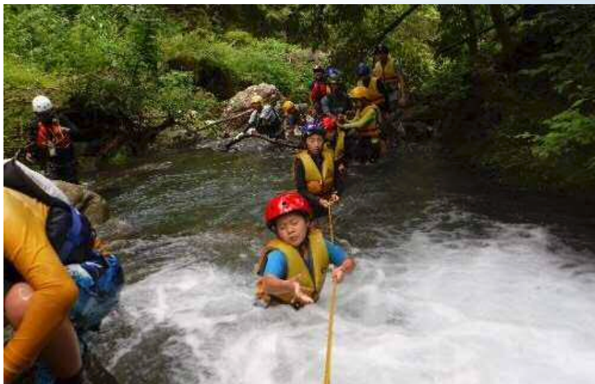
夏休み6泊7日子ども探検キャンプで沢登り