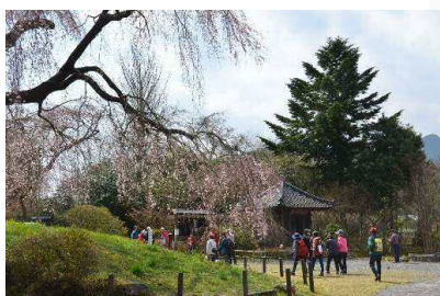
村の住民がガイドするフットパスツアー／宮の原