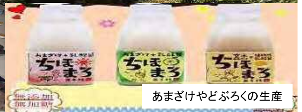
あまざけやどぶろくの生産