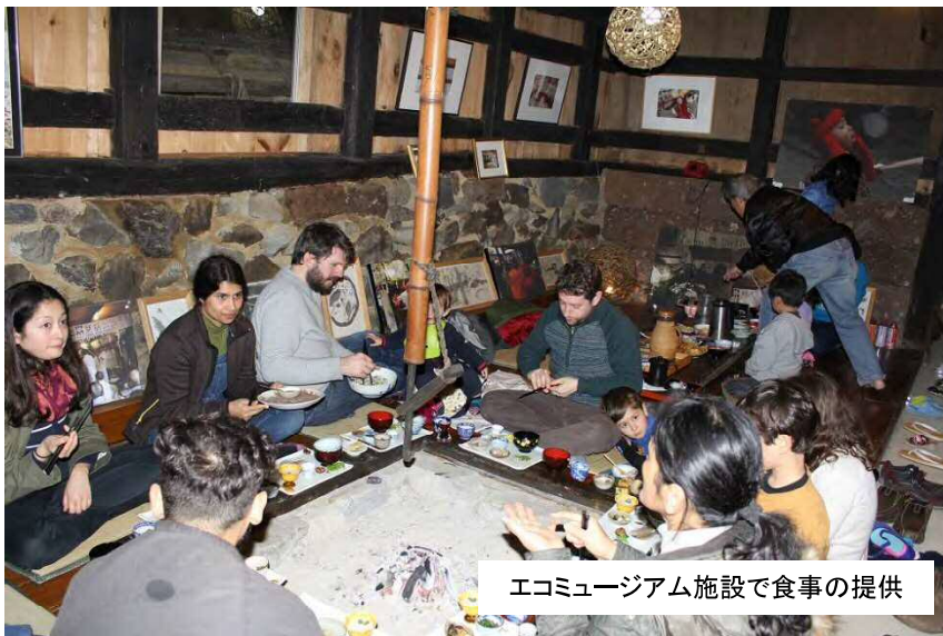
エコミュージアム施設で食事の提供