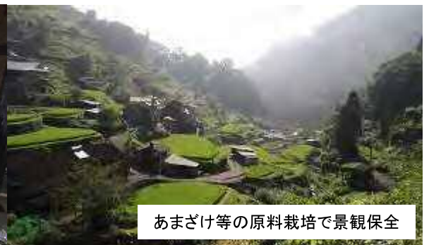
あまざけ等の原料栽培で景観保全