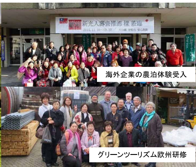
海外企業の農泊体験受入