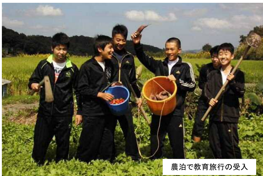
農泊で教育旅行の受入