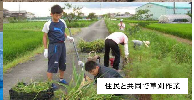
住民と共同で草刈り作業