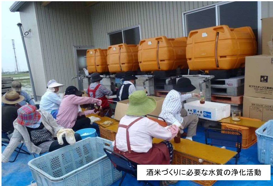
酒米づくりに必要な水質の浄化活動