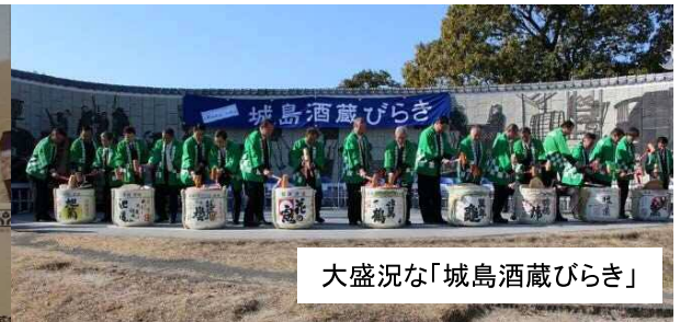
大盛況な「城島酒蔵びらき」