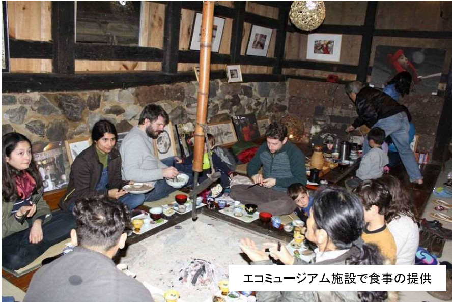
エコミュージアム施設で食事の提供