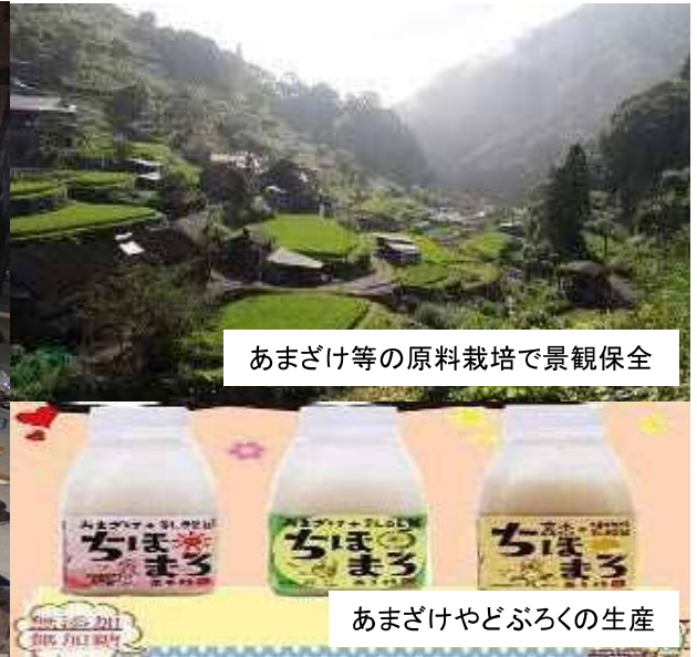
あまざけ等の原料栽培で景観保全