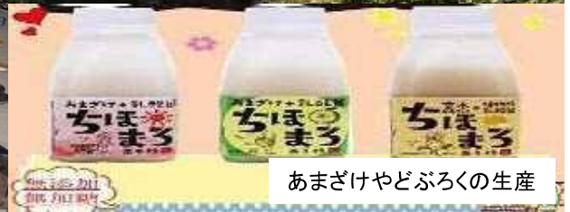
あまざけやどぶろくの生産