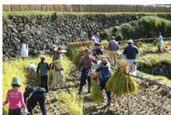
米づくり体験（田植・稲刈り）