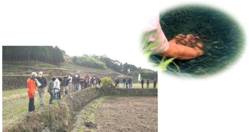
メダカ観察会風景とクロメダカ