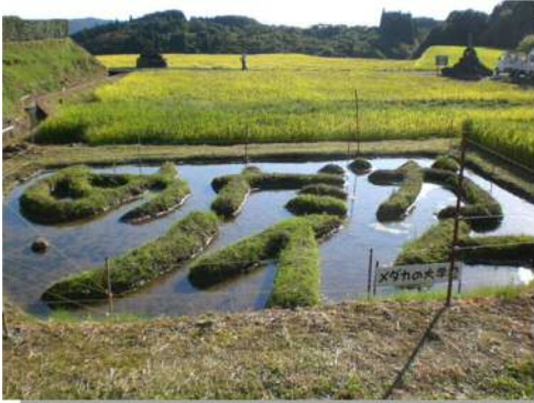
尾木場地区のメダカの池

尾木場地区では、生ものの生息環境に配慮した水路やため池を整備し、また共同作業によって棚田の保全、ため池等の管理に努めている。