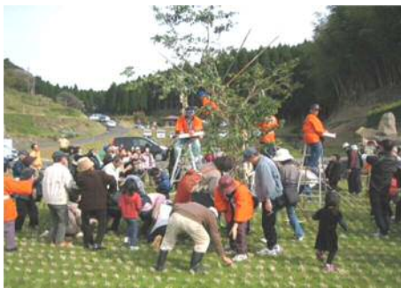
高山ふるさと秋まつり