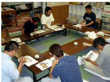
体験イベント等の検討