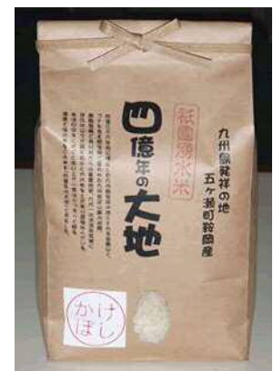
ブランド米 「四億年の大地米」