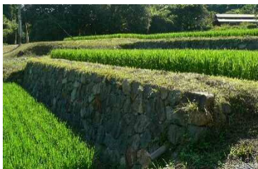
石積みで修復された美しい棚田

「四季彩のむら」は、高鍋町の高平・大平寺地区にある山間農地（田畑計 6ha）で、その生産者で構成される活動団体の名称でもある。この地域には、都市と農村がバランスよく共生していた昭和 30 年代の農村風景の面影があることから、これを学習やすらぎの場を提供する地域資源として残そうと、平成 13 年から町と地域が連携し、石積み棚田や耕作道の整備など修景に着目した事業を展開している。