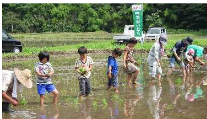
親子の農村体験（田植・稲刈）