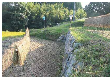
秋を感じる稲の掛け干し

親子での農村体験をはじめ、ウォークラリーや、役場の若手職員有志の「たかなべ希望のまちづくりグループ」と連携しながら、観賞用水稻で描く水田アート（35a）の鑑賞会など多彩なイベントを展開し地区内外の交流を行っている。