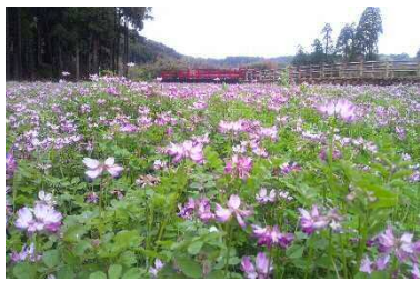
春の水田を彩るレンゲ（緑肥）

昭和 30 年代の農村風景をイメージし、町と連携しながら、遊歩道、石積み棚田や耕作道に架かる橋の整備などの修景、鯉のぼり掲揚や彼岸花、山桜の植栽に取り組んでいる。また、現在は周辺地域では早期米がほとんどであるが、当時は普通期米が主流であったことから、普通期米の栽培に切り替えることで、田では、春にはレンゲ、夏には水稻、秋には稲穂の掛け干しやソバの栽培など、四季折々の景色を楽しむことができるようにしている。