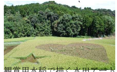
観賞用水稻で描く水田アート