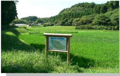
「四季彩のむら」の風景