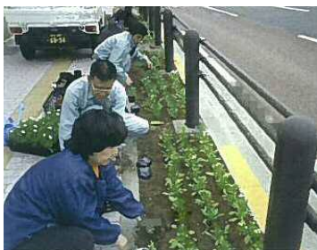
地域の美化にも貢献 （花と緑の普及活動）