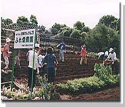
ふれ愛農園（交流拠点）