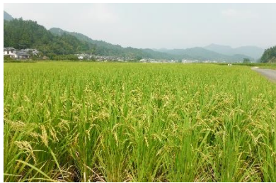
大明地区のほ場整備竣工記念碑(上)と水田風景(下)

大明地区は、日田市西部を流れる大肥川沿いの 17 集落にまたがり細長く広がる水田地帯で、ほ場整備事業（平成 9～18 年）により大区画化を図り、これを契機として、平成 15 年度に共同営農を行う「大肥郷ふるさと農業振興会」を設立した。