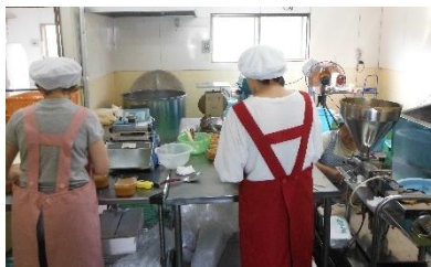
「ももは工房」での味噌づくりの様子