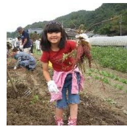
稲刈りや芋掘りの農業体験の様子