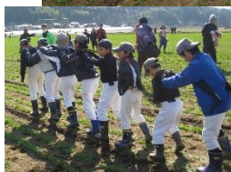
麦踏み大会の様子