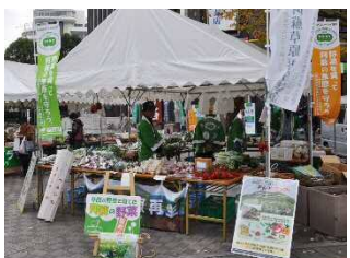
農作物の販売状況 (消費者への理解増進)