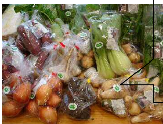
シールを貼った農産物