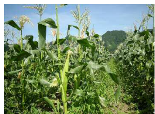
堆肥を使った農作物の栽培