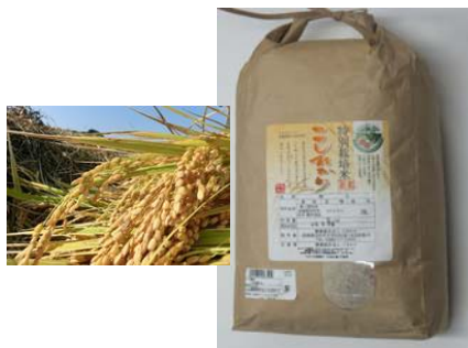
特別栽培米コシヒカリ