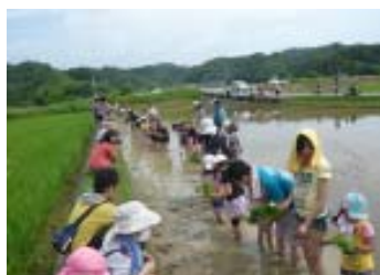
↑ ワクワク 田植探検 隊 (6月)