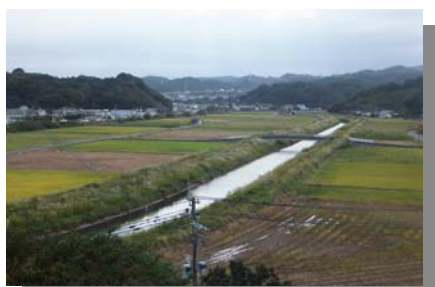
庄手・梶木地区の田園風景