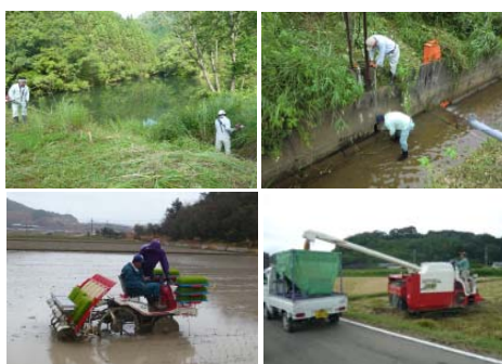
ため池・水路の管理作業の様子（上）、田植え・収穫の様子（下）

毎年開催されるワクワク田植探検隊及び稲刈り探検隊は、子供と保護者併せて約 120 名が参加するビッグイベントで、参加者募集は同市内の NPO 法人こども遊センターが行い、現場の設定や特別栽培米コシヒカリのおにぎり等の準備は同農地水環境部会が役割を担い連携しながら実施している。また、ワクワク水生動物調査を開催し、子供たちに地域の自然や環境保全の意識付けも実施している。