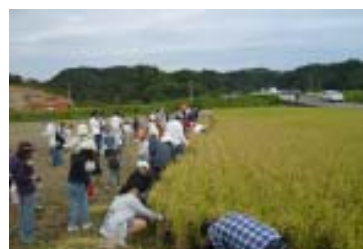
↑ ワクワク 稲刈り探 検隊 (10月)