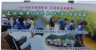
集落入り口に設置された看板

日向市の北部に位置し、耕地の大半を水田が占める庄手・梶木地区では、遊休農地の発生、担い手不足等の問題解決のため、平成 23 年 4 月に地元農家を中心に「農事組合法人ひまわり」（経営面積 14.1ha、作業受託約 10ha、構成員数 56 名：平成 26 年度）を設立した。