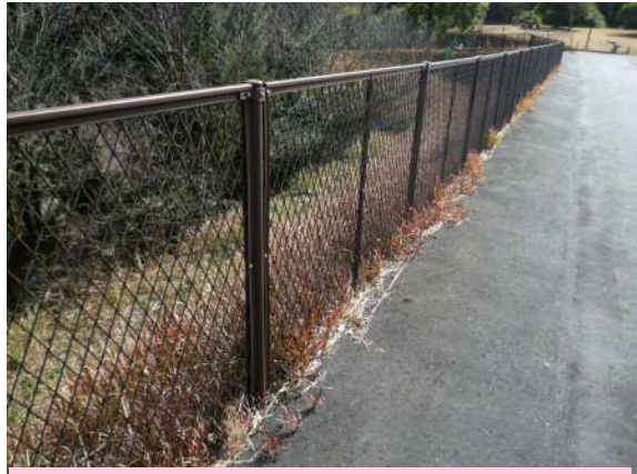
農園周囲に設置された鳥獣害防止柵