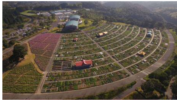
右側2ブロックが農園ゾーンとなる