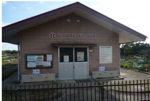
園内3箇所を設置されるレストハウス

農園で野菜を栽培することにより、土とふれあい農業を理解してもらうとともに、市民相互の交流促進と健康づくりを目的に、平成9年の都市農業センター開設時に本市民農園がセンター内に設置されることとなった。当時のガーデニングブームもあり、公設の市民農園開設を望む声が多かったことも後押しとなった。