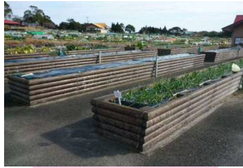
車いす使用者用区画