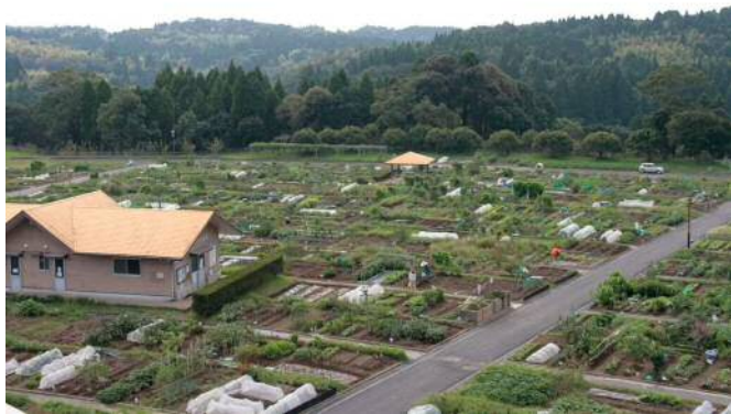
鹿児島市都市農業センター市民農園

市民農園は市民の農業に対する理解と相互の交流を深め、あわせて市民の健康作りに資する区画として、本センター内に設置されている。