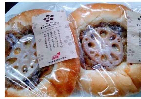
“パン DE レンコン” 地域の特産「レンコン」を活用