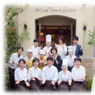
直営店舗ひなたまごっこ