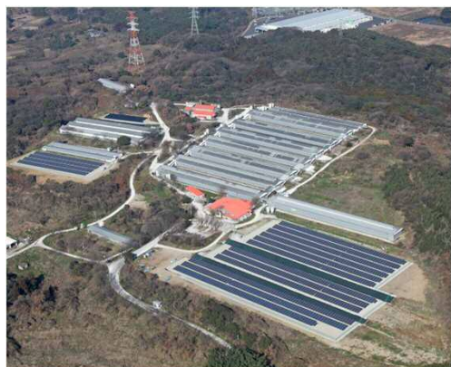
サンファーム農場全景