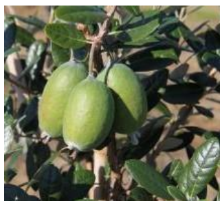
フェイジョアの実