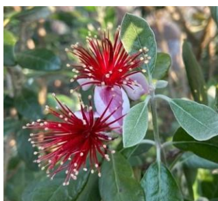
フェイジョアの花