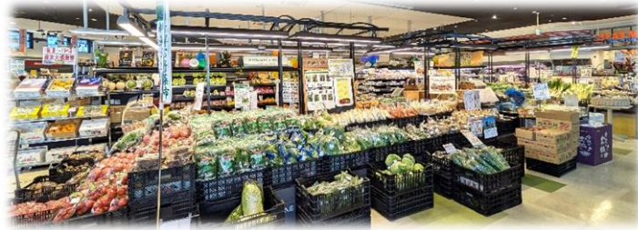
※写真は全て新大江店