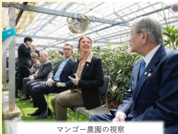
マンゴー農園の視察 野村農林水産大臣と各国の大臣