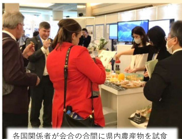
各国関係者が会合の合間に県内農産物を試食