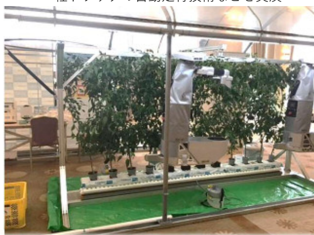
自動収穫(しゅうかく)ロボット(AGRIST株式会社)の展示 労働力不足の解消や農家の収益向上に期待