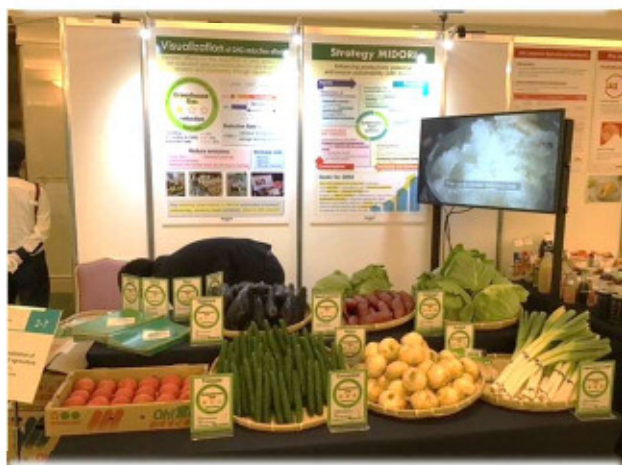
栽培(さいばい)時の温室効果ガスの削減状況を 星の数で表示「見える化」した農産物の展示