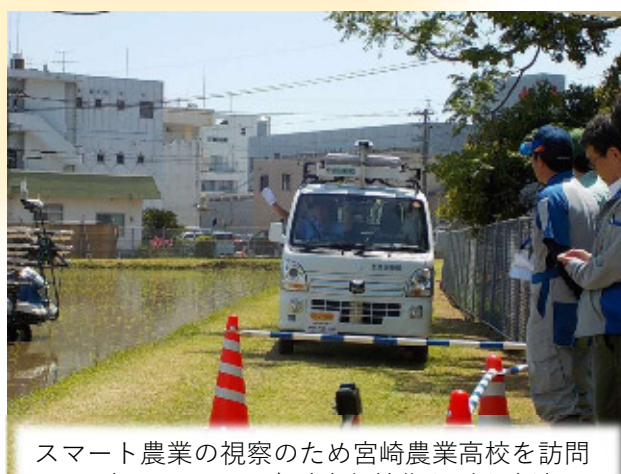
スマート農業の視察のため宮崎農業高校を訪問 軽トラックの自動走行技術などを実演