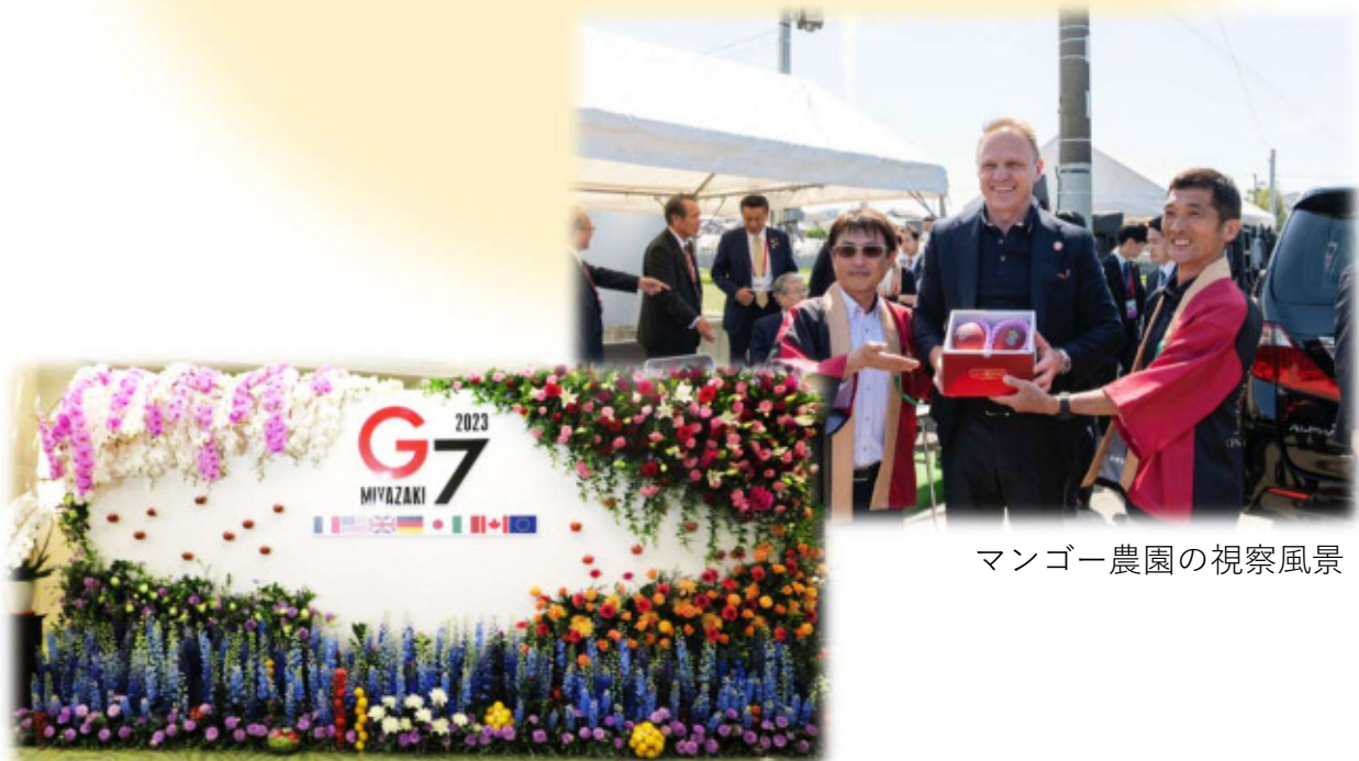
マンゴー農園の視察風景

この会合では、「G7農業大臣声明」と、G7各国が取り組むべき行動をまとめた「宮崎アクション」が採択されました。