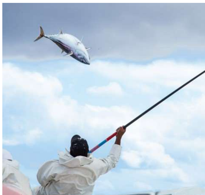
日南かつお一本釣り漁業の風景 （農林水産省ホームページ）

日本農業遺産 に認定されている日南市の かつお一本釣り漁業は300年も続く伝統漁業で、大規模化する現代の漁業とは対照的に、必要な量だけ釣り上げ、かつおの資源を守ることを優先し、昔ながらの技術が受け継がれています。また、船を造るために杉の林を造った歴史を持つ飫肥(おび)林業とともに発展し、広大な飫肥杉の山々の恵みを伝統漁や地域の中で利用しています。