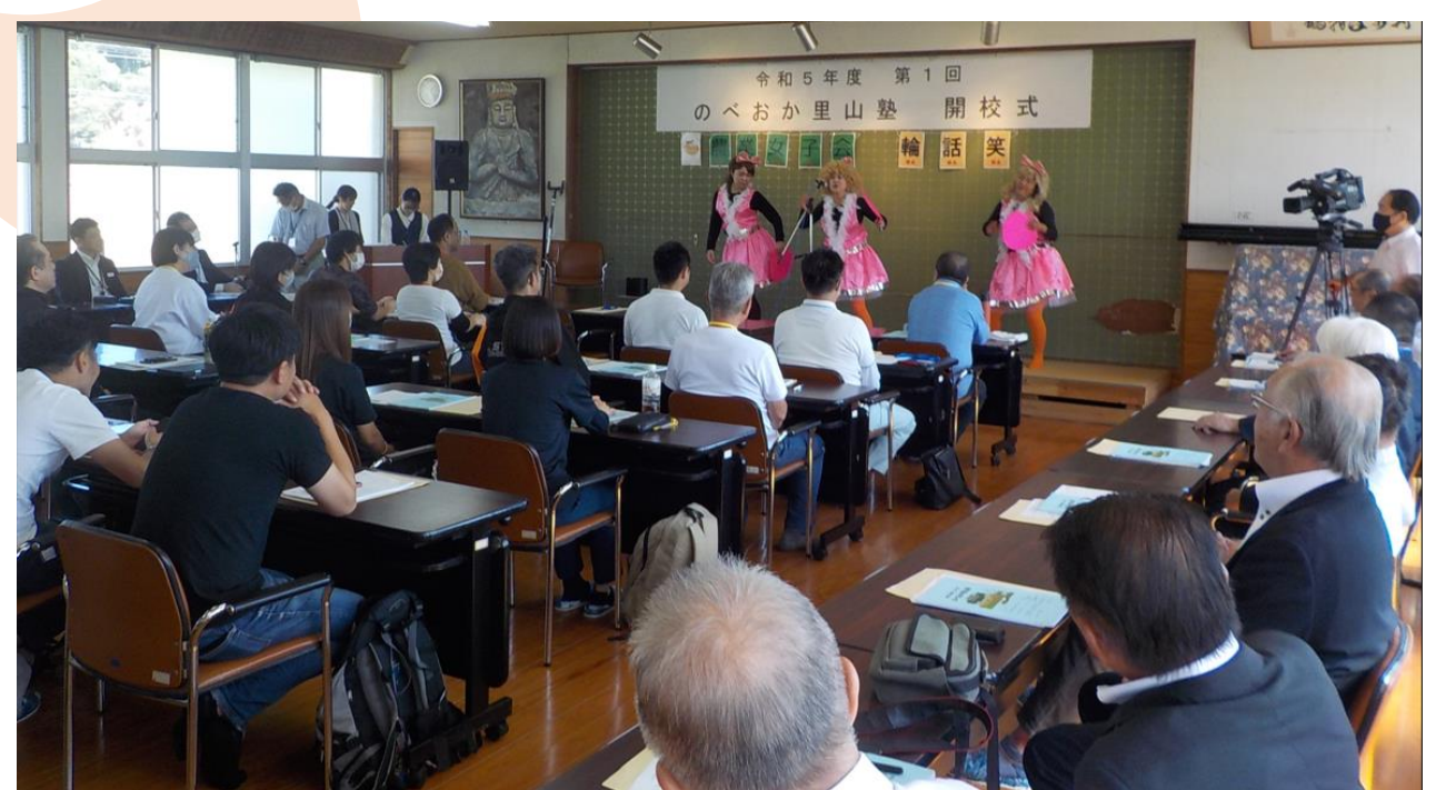
写真上 開校式、写真下 歓迎セレモニー