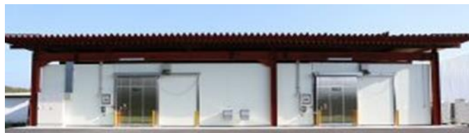
キュアリング貯蔵庫

(※キュアリングとは、さつまいもを貯蔵前に一定期間高温多湿条件下において傷口にコルク層をつくること。このことにより病原菌などの侵入を防ぐことができる。)