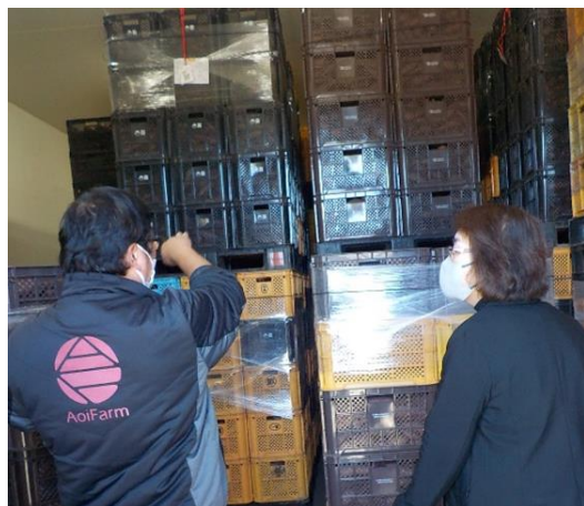
貯蔵庫でキュアリング処理中のさつまいも