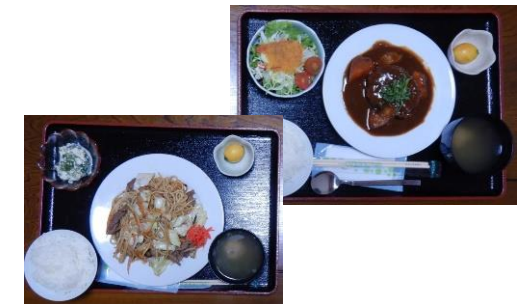
市内中心部の直営料理店「そしじ」でも、ジビエ料理が召し上がられます。