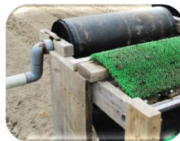
手作りの除草シート巻き