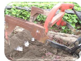
サツマイモ収穫機（自身で溶接）