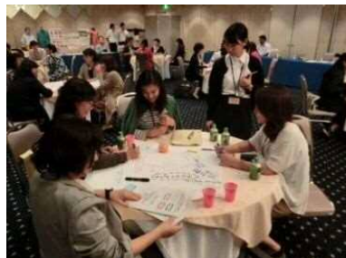
女性農業者同士をマッチング