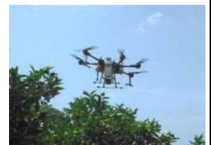
ドローンと みかん生産者を マッチング

傾斜地での労力軽減を図りたいみかん生産者と、現場での実証を進めたいドローン代理店とのマッチングを行い、ドローンによる防除の実証試験を実施しました。