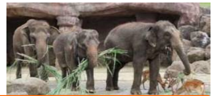
象さんと若手農業者を マッチング