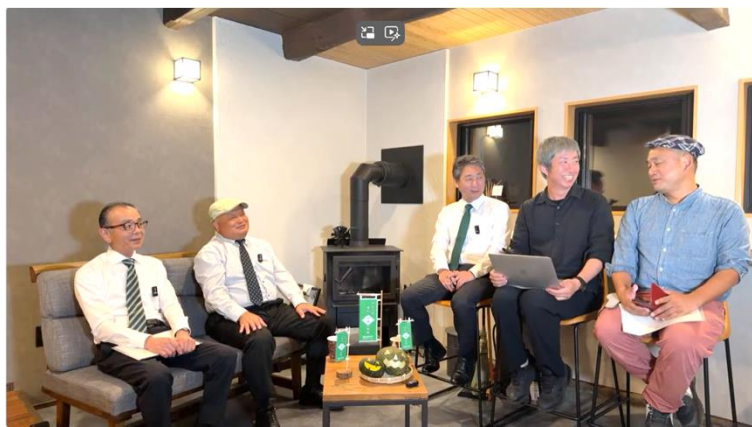
みどりの食料システム戦略LIVE20251027