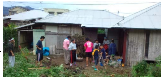
地域ぐるみで空き家を改修 人口、19歳以下人口の比率等の推移