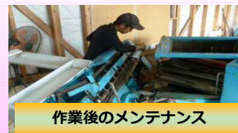
作業後のメンテナンス