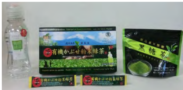
シェイクイット 粉末緑茶 黒糖茶(霧島茶×黒糖)