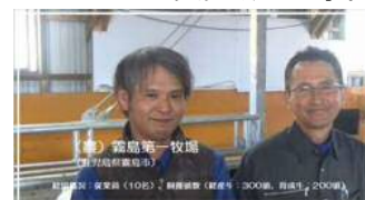
乳肉複合酪農トータルスマート ファーム実証(鹿児島県)