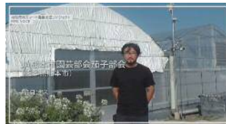
「日本一園芸産地プロジェクト」 スマート農業実証(熊本県)