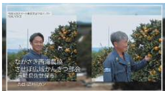
スマートみかん生産 (長崎県)