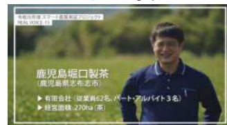
堀口製茶スマート農業実証 (鹿児島県)