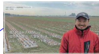
福岡R・O・Iグループ 次世代農業実証(福岡県)