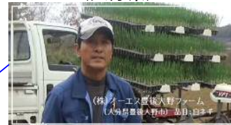
大分白ねぎスマート農業実証 (大分県)