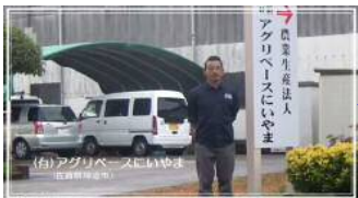
アグリベースにいやま スマート農業実証(佐賀県)