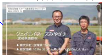
加工業務向けほうれん草等 スマート農業実証(宮崎県)