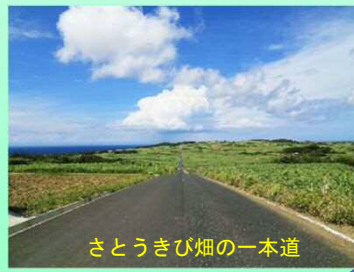
さとうきび畑の一本道