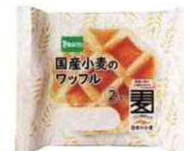
国産小麦の ワッフル

[関連ウェブページ] https://www.pasconet.co.jp/csr/