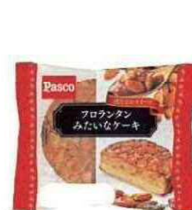
「満たされスイーツ」シリーズ フロランタンみたいなケーキ

流通や消費段階における食品ロス低減のため、消費・賞味期限を延長する取組みを行っています。2020年10月には「満たされスイーツ」シリーズ、11月には「麦のめぐみ全粒粉入り食パン」の消費期限を、2021年5月には「国産小麦のワッフル」の賞味期限を延長しました。今後も品質を担保したうえで期限延長の取組みを継続していきます。