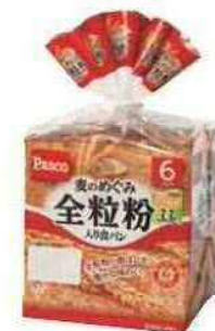
麦のめぐみ 全粒粉入り食パン