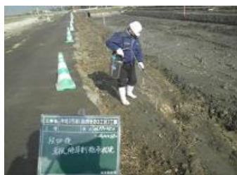
【植生管理(除草剤散布)】