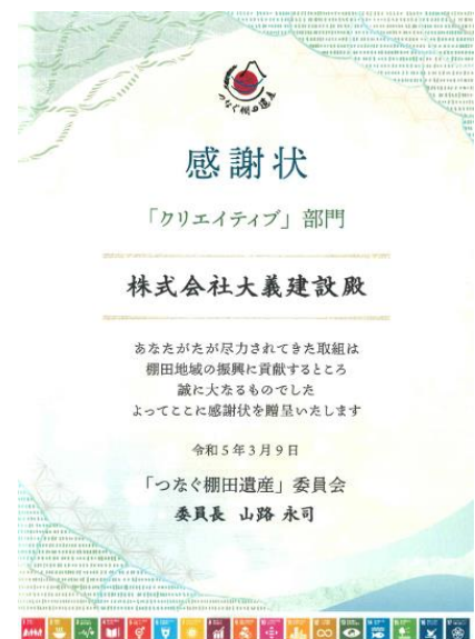
【棚田活動の感謝状】