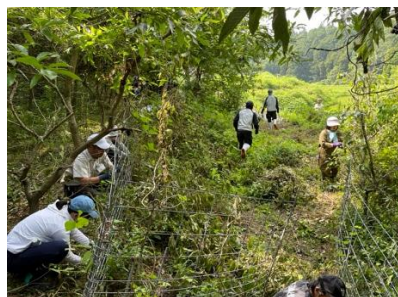
【棚田のワイヤーメッシュの補修】