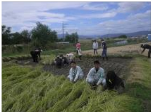
【稲刈り・稲干しの体験学校】