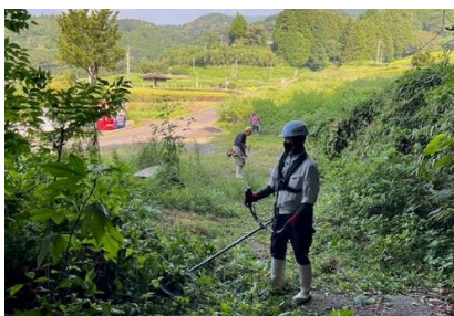
【棚田の耕作放棄地の草刈り】