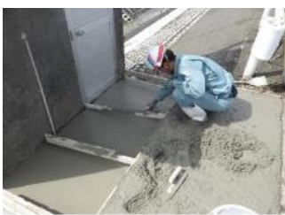
【現場内の施設整備】