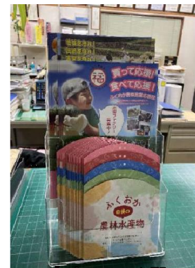
【パンフレット配布】