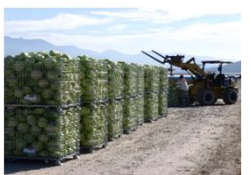
収穫したキャベツ