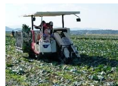
収穫機での収穫作業

キャベツ収穫機の導入により、腰をかがめていた収穫作業を立ち作業に改善。従業員の負担軽減につながるとともに、作業効率が向上。