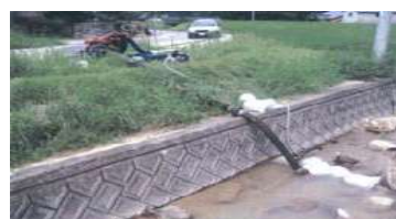
災害応急用ポンプ

緊急の場合、各地方農政局が保有管理している、災害応急用ポンプ、排水ポンプ車等を貸出しています。