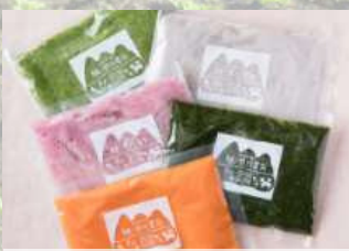
早川農苑の野菜ピュレ

自然生態系農業により約60品目の野菜等を4.5haの規模で生産。農産物の加工、販売のほか、様々な「体験」を消費者に提供し、農業の魅力を積極的に発信する。農業インターンシップ等も実施。農苑スタッフのうち数十名が早川氏の理念を引き継ぎ独立就農している。 ※早川氏代表時のデータ。