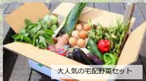
大人気の宅配野菜セット