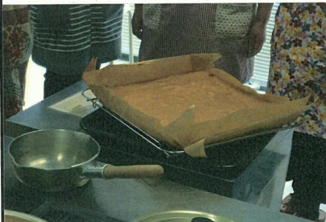
⑤ ティラミス米粉スポンジ